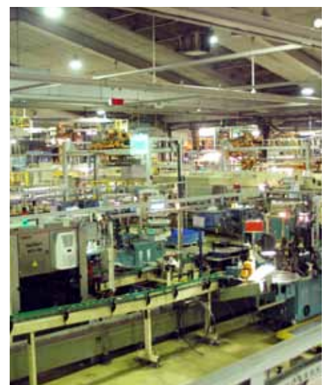
Werkhalle des Glasherstellers Verallia / Saint-Gobain Oberland AG in Neuburg

Bei der Umsetzung Ihrer Vorhaben stehen Ihnen die Innovationsberatungsstelle Südbayern, die Regierung von Oberbayern, das Landratsamt Neuburg-Schrobenhausen und die Stadt Neuburg an der Donau UNTERSTÜTZEND zur Seite. Für Baugenehmigungen ist die Stadtverwaltung selbst zuständig; wir garantieren Ihnen, dass Sie hier schnell, präzise und wirtschaftsfreundlich bedient werden.