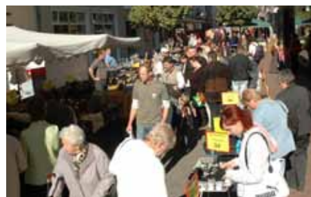
II Innenstadtbereich während eines Marktsonntags

Abseits von Lärm und Hektik der großen Städte bietet Neuburg noch Spaß und Freude beim Einkaufsbummel. Egal ob in der verkehrsberuhigten Innenstadt mit seinen inhabergeführten Einzelhandelsgeschäften, beim Wochenmarkt, in großen Einzelhandelsbetrieben im weiteren Citybereich oder im Fachmarktzentrum - die ATTRAKTIVEN Einkaufsmöglichkeiten lassen keine Shoppingwünsche offen. Bekannte Filialisten, erlesene kleine Bouti-